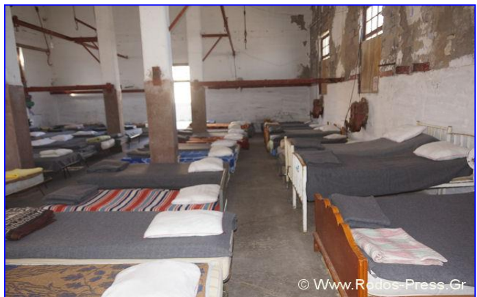
Άποψη από το εσωτερικό των Σφαγείων

Ο χώρος στα Σφαγεία αποκαλείται από τους εμπλεκόμενους «χώρος φιλοξενίας» και ως τέτοιος αντιμετωπίζεται. Εντός του χώρου βρίσκονται εκατό (100) κρεβάτια και επιπλέον υπάρχουν ένας χώρος mother's friendly, όπου έχουν τοποθετηθεί αυτοσχέδια παραβάν, μία μικρή κουζίνα με περιορισμένες δυνατότητες, δύο (2) βιολογικές τουαλέτες, που τοποθετήθηκαν με μέριμνα του Δήμου και παράλληλα ενεργοποιήθηκαν τρεις (3) παλαιές τουαλέτες οθωμανικού τύπου, τις οποίες εξευρωπαϊσαν και μία τέταρτη. Ακόμα υπάρχουν πέντε (5) ντουζιέρες. Δεν υπάρχει όμως ζεστό νερό και εκφράστηκε η ανάγκη για την τοποθέτηση δύο θερμοσιφώνων. Υπάρχει μία γωνιά ιατρείου/φαρμακείου και λίστα με είκοσι (20) περίπου ιατρούς οι οποίοι βρίσκονται σε ετοιμότητα σε περίπτωση που ανακύψει κάποια ανάγκη. Υπάρχουν επίσης αποθηκευτικοί χώροι, ο ένας εκ των οποίων είναι σε ετοιμότητα να μετατραπεί σε