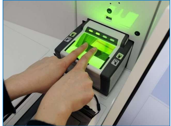
Μηχάνημα Eurodac

Ένα ακόμη ουσιαστικό πρόβλημα που προκύπτει με το μηχάνημα της Eurodac είναι ότι μόνο ένα άτομο μπορεί να το χειρίζεται κάθε φορά ώστε να παίρνει αποτυπώματα, ενώ με το μελάνι μπορούν περισσότερα άτομα να ασχολούνται με τη διαδικασία λήψης αποτυπωμάτων ταυτοχρόνως. Επομένως καταλήγει να κρίνεται ως προτιμητέο το μελάνι για τη λήψη δαχτυλικών αποτυπωμάτων, τα οποία στη συνέχεια σκανάρονται και αποστέλλονται στο Τμήμα Εγκληματολογικών Ερευνών Αστυνομικής Διεύθυνσης στη Ρόδο, απ' όπου και καταχωρούνται στην Εθνική Βάση Δεδομένων της Eurodac. Σε κάθε περίπτωση, τέθηκε ως ζήτημα το γεγονός της υποστελέχωσης της Αστυνομίας, το οποίο δυσχεραίνει την αποτελεσματικότητα της εργασίας της.