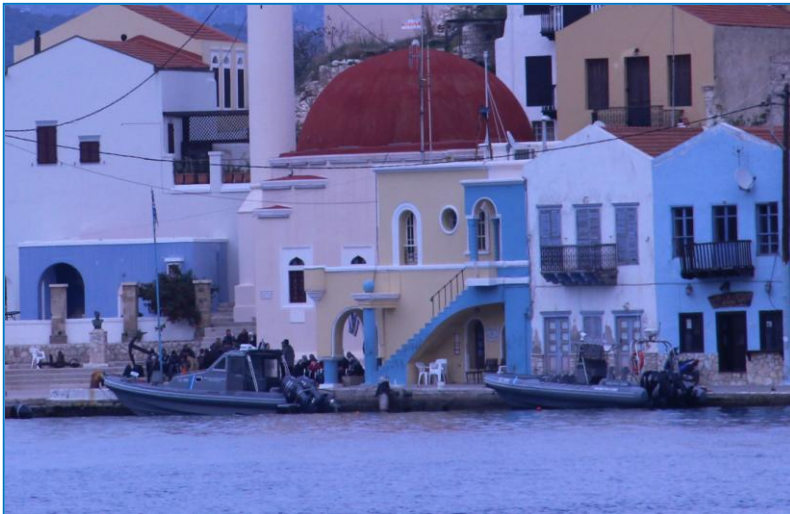
Αφίξη στη Μεγίστη

Η ν. Μεγίστη χαρακτηρίζεται από έλλειψη παραλιών και από έντονα κοφτερά βράχια, τα οποία καθιστούν την πρόσβαση στο νησί ιδιαίτερος επικίνδυνη. Οι νεοεισερχόμενοι καταφθάνουν είτε σε δύσβατα σημεία του νησιού, ή στις νήσους Στρογγύλη και Ρω και άμεσα αναλαμβάνει τη διάσωσή τους το Λιμενικό. Η διαδικασία που ακολουθείται κατά τις αφίξεις είναι αρχικά ο απεγκλωβισμός των νεοεισερχομένων από τα βράχια και η μεταφορά τους εν συνεχεία στο Λιμενικό Σταθμό για τη λήψη αποτυπωμάτων και τη σύνταξη της δικογραφίας. Αντίστοιχα, όταν η σύλληψη είναι της Αστυνομίας και δη στις περιπτώσεις εκείνες που οι νεοεισερχόμενοι έχουν καταφτάσει κοντά στο στρατόπεδο, τότε είτε ενημερώνουν την Αστυνομία οι φαντάροι, είτε κάποιος από την ίδια την ομάδα των νεοαφιχθέντων προσέρχεται στο Αστυνομικό Τμήμα (Α.Τ.) και ενημερώνει σχετικά, οι νεοεισερχόμενοι οδηγούνται στο Α.Τ., όπου γίνονται οι διαδικασίες καταγραφής και ταυτοποίησής τους. Στο Α.Τ. Μεγίστης προκρίνουν τη λήψη δαχτυλικών αποτυπωμάτων με το ένα μηχάνημα της Eurodac, το οποίο βρίσκεται στην κατοχή τους. Δεν υπάρχει διερμηνέας να συνδράμει τη