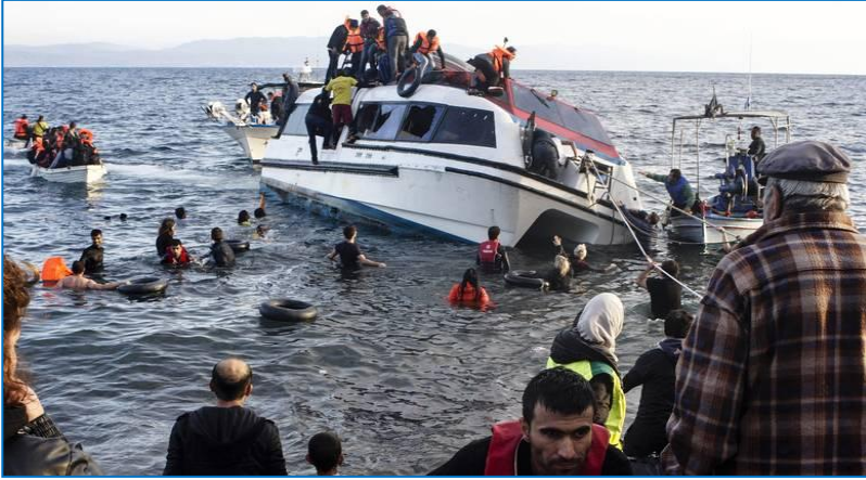
Επιχείρηση διάσωσης στα Δωδεκάνησα

Παρόλο που η Ρόδος δε χαρακτηρίζεται από τα υψηλά νούμερα νεοεισερχομένων που χαρακτηρίζουν άλλα νησιά, λόγω της σχετικά μεγάλης απόστασής της από την Τουρκία, και συγκεκριμένα τα 18 χλμ. που τη χωρίζουν από αυτήν, εντούτοις σημειώνει σταθερά αφίξεις, οι